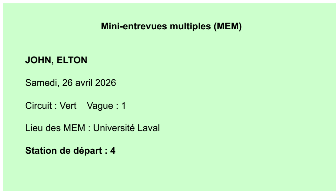
Figure 5. Exemple de carte séquence ou étiquette

La figure 5 montre les informations qui se trouvent sur la carte séquence ou l'étiquette.