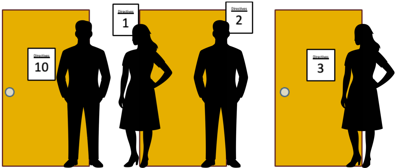
Figure 2. Place des personnes candidates aux stations

Après la station, la personne candidate qui était à la station 1 se déplace pour se placer devant la station 2 alors que la personne qui était à la station 10 se place à la station 1 et la personne à la station 2 se place devant la station 3 (voir figure 3). Pour les stations d'interaction entre personnes candidates, il est normal d'entrer deux (2) fois dans le même local.