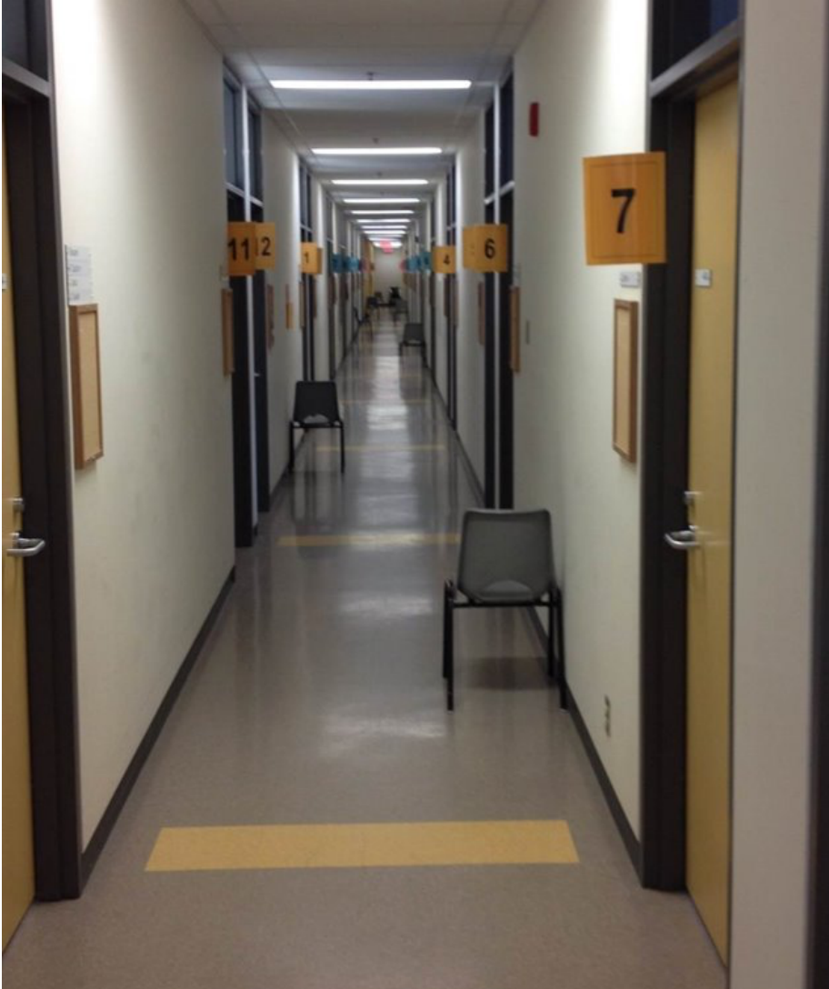
Figure 4. Circuit de stations

Chaque personne candidate doit effectuer dix (10) stations MEM d'une durée de sept (7) minutes réparties dans un circuit associé à une couleur, comme illustré à la figure 4.